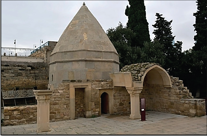
Fotoğraf 6: Halvetiyye-Şabaniyye Tarikatı Müntesiplerinin Pir-i Sani Seyyid Yahya Şirvanî Türbesine Ziyaretleri (1 Ekim 2024)