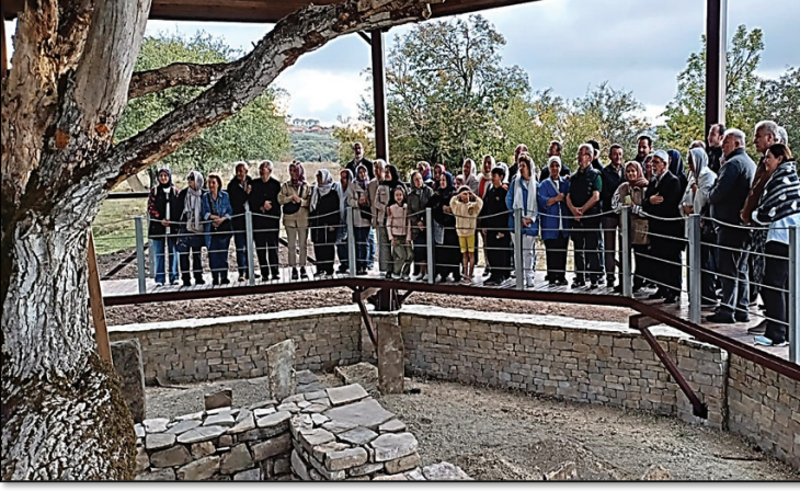
Fotoğraf 4: Pir-i Evvel Ömer el-Halvetî Kabr-i Şerifi Yanında Bulunan Kabirler (3 Ekim 2024)