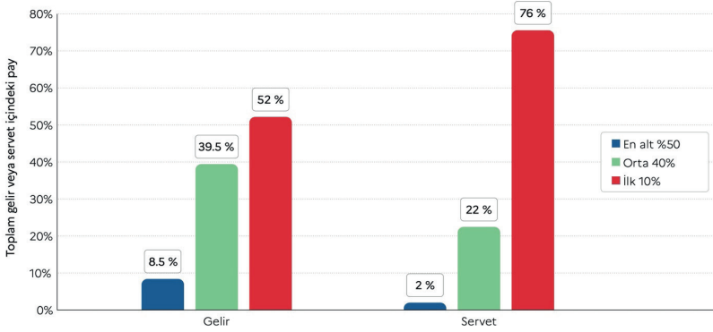
Grafik 1: Küresel Gelir ve Servet Eşitsizliği, 2021