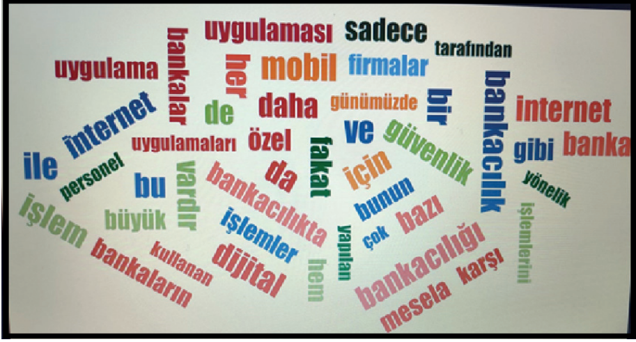
Şekil 1: Mülakatlarda en çok tekrarlanan kelimeler bulutu.