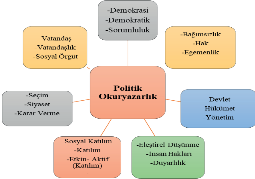
Şekil 1: SBDÖP Kontrol listesi tablosu

renme alanlarının içerisinde politik okuryazarlık ile ilgili kazanımların tespit edilebilmesi için; politik okuryazarlık ile ilgili ilişkilendirilebilecek ifadelerin yer aldığı bir kontrol (ölçüt) listesi hazırlanmıştır. İlgili literatür taraması ve uzman görüşleri [Sosyal Bilgiler Eğitimi Alanında Doç. Dr. (f:2)] doğrultusunda oluşturulan bu kontrol listesinde yer alan ifadeler şekil 1 'de sunulmuştur.